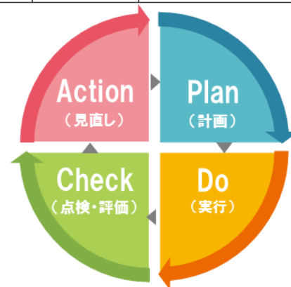
図 PDCA サイクル